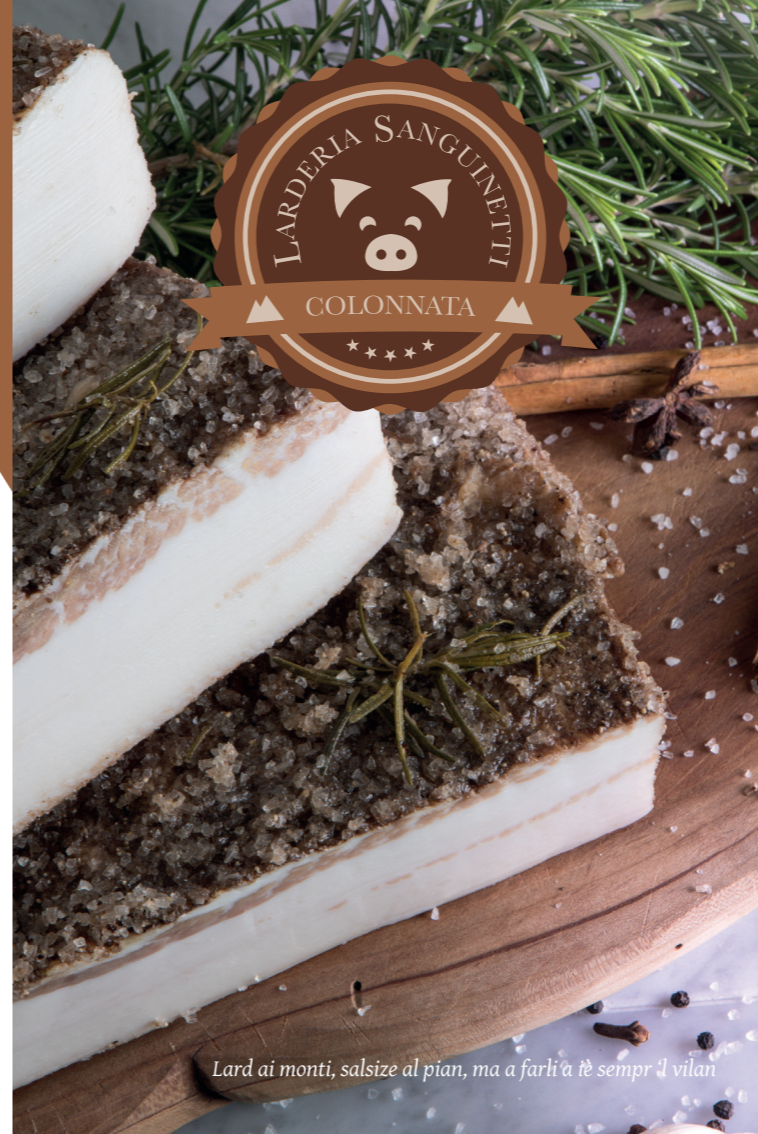
Lard ai monti, salsize al pian, ma a farli a tè sempr il vilan

Ditta artigiana Larderìa Sanguinetti Via Giardino, 6/t 54033 Colonnata (MS) Toscana - Italy tel: +39 0585 768015 email: info@larderiasanguinetti.it web: www.larderiasanguinetti.it