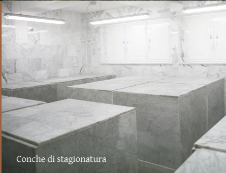
Conche di stagionatura

Larderìa Sanguinetti è una ditta artigiana che produce Lardo di Colonnata IGP, pancetta tesa e guanciale, a Colonnata, paesino nel cuore delle Alpi Apuane.